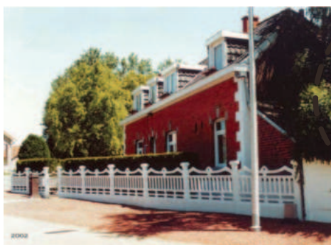
Voormalige woning familie Aerts in 2002. Geschiedenis Groot-Heers.