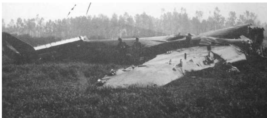
Halifax DT804 te Duras, Budingens.